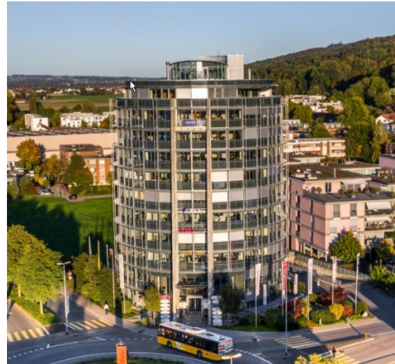
Sitz der visaVento Holding AG

Die visaVento Holding AG ist einer der führenden, unabhängigen Schweizer Windparkbauer. Die Firma ist spezialisiert auf die Planung und Errichtung von Windkraftanlagen im EU-Raum.